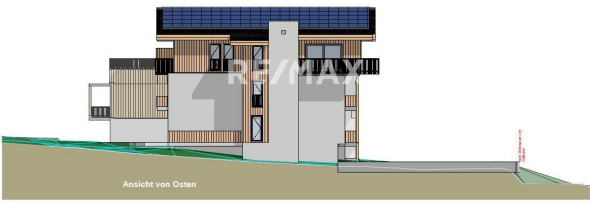
Ansicht von Osten