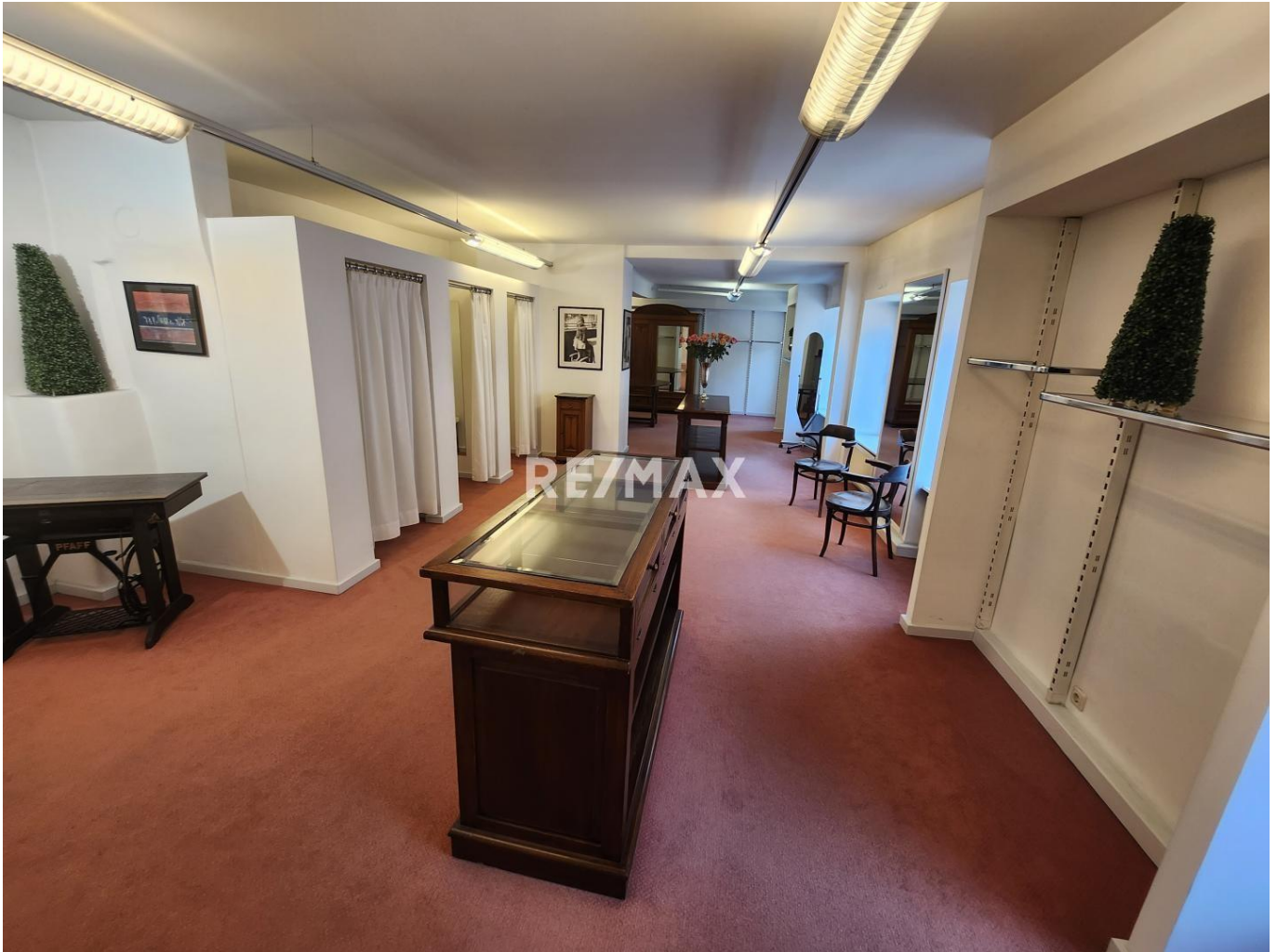
OG Raum 1