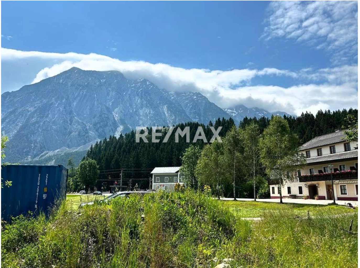
Ausblick zum Grimming