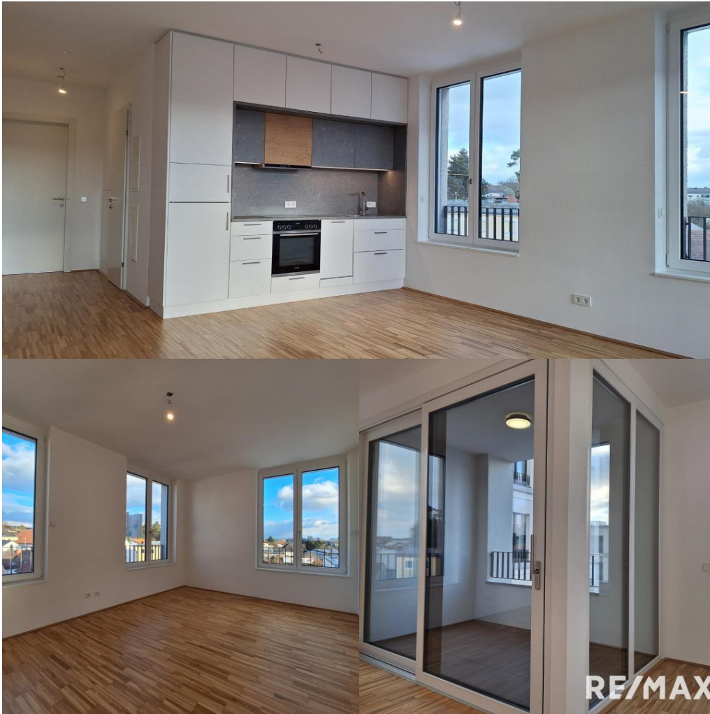
Lichtdurchflutet und zentral: 2-Zimmer-Wohnung