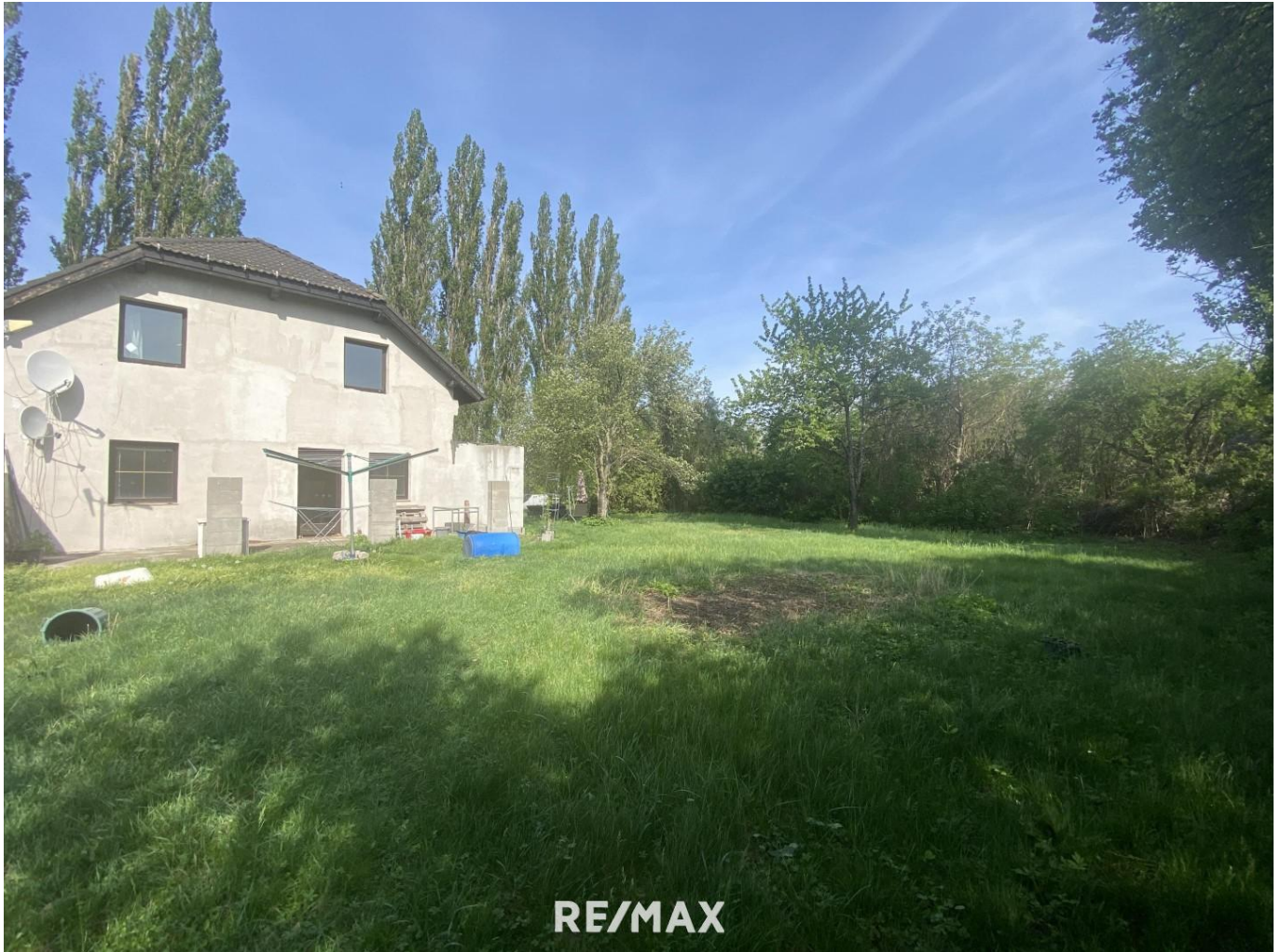
Haus mit großem Garten