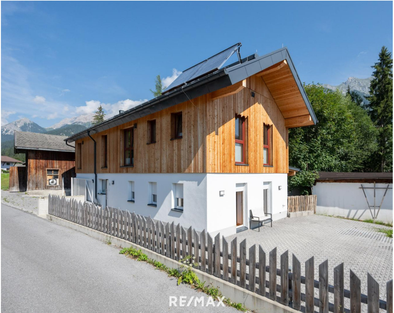
Haus mit Terrasse