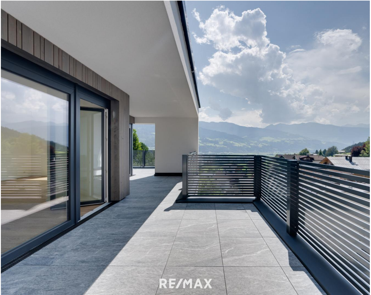
Top 2 Terrasse