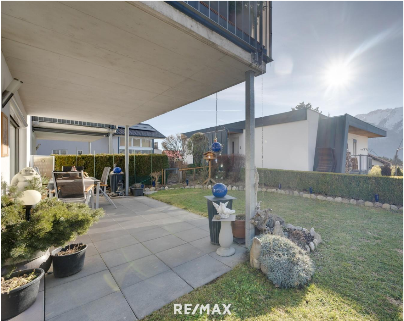
Garten mit überdachter Terrasse