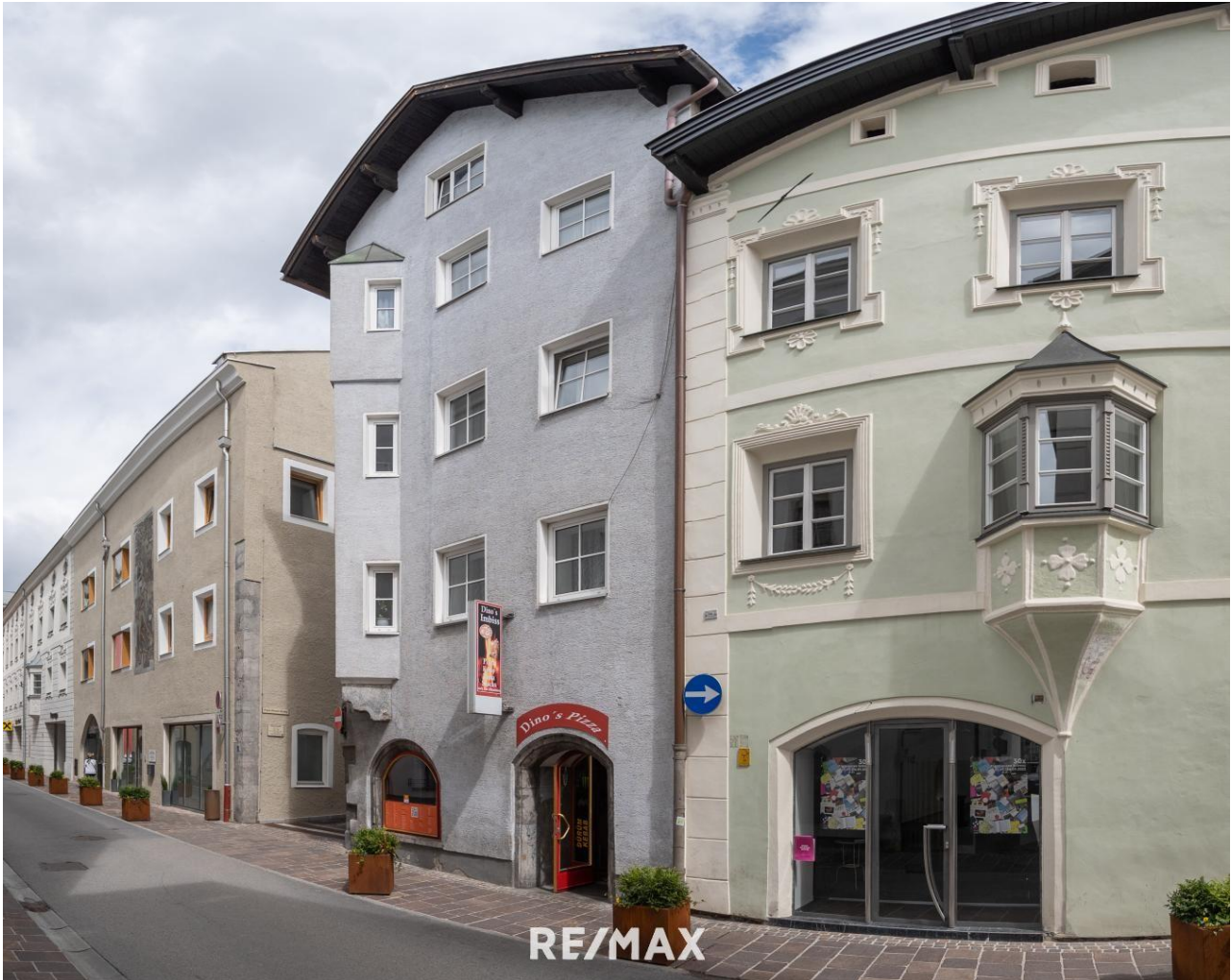
Panoramabild Ansicht Wohnhaus