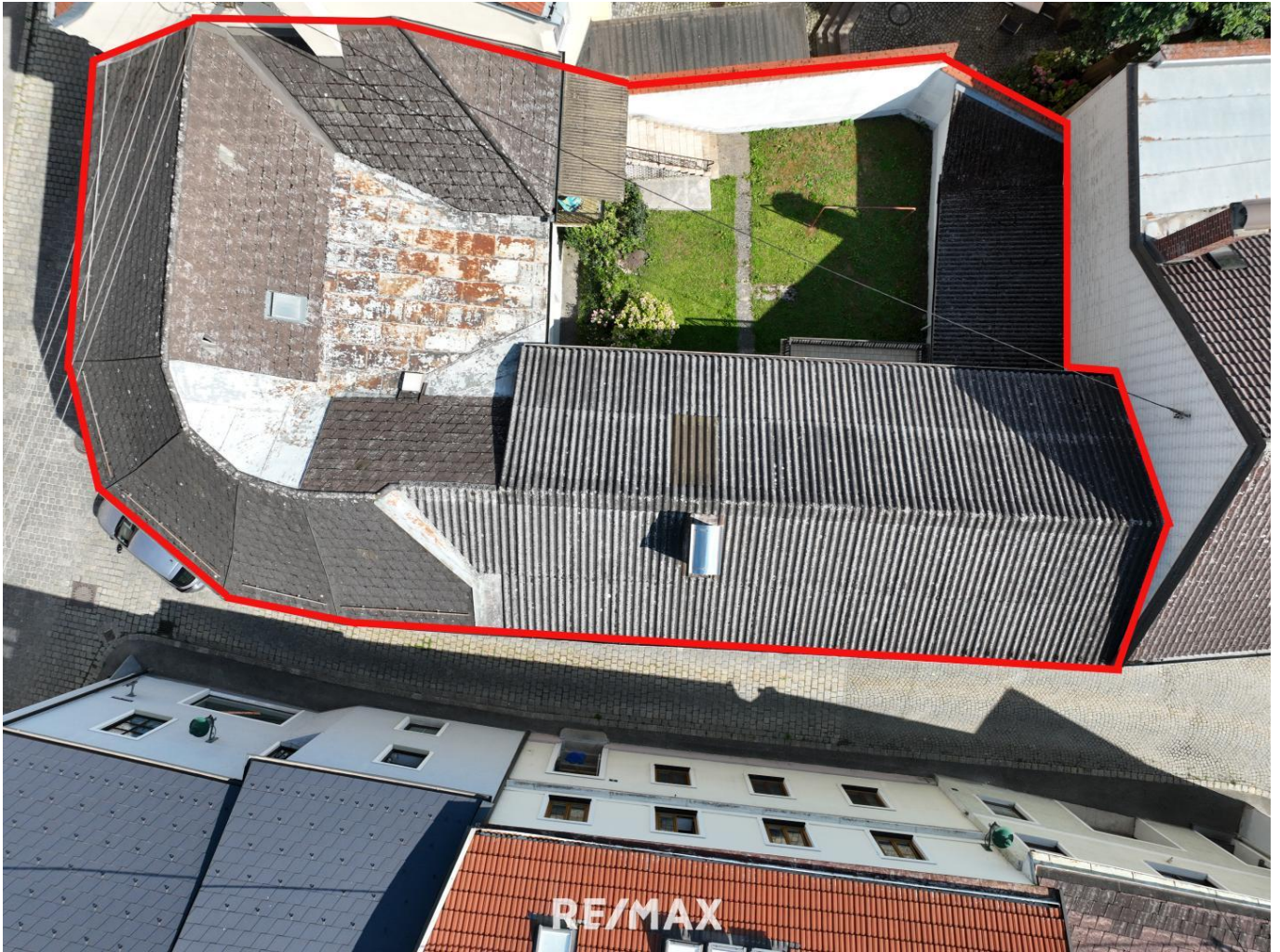
Altstadthaus mit zwei Eingängen