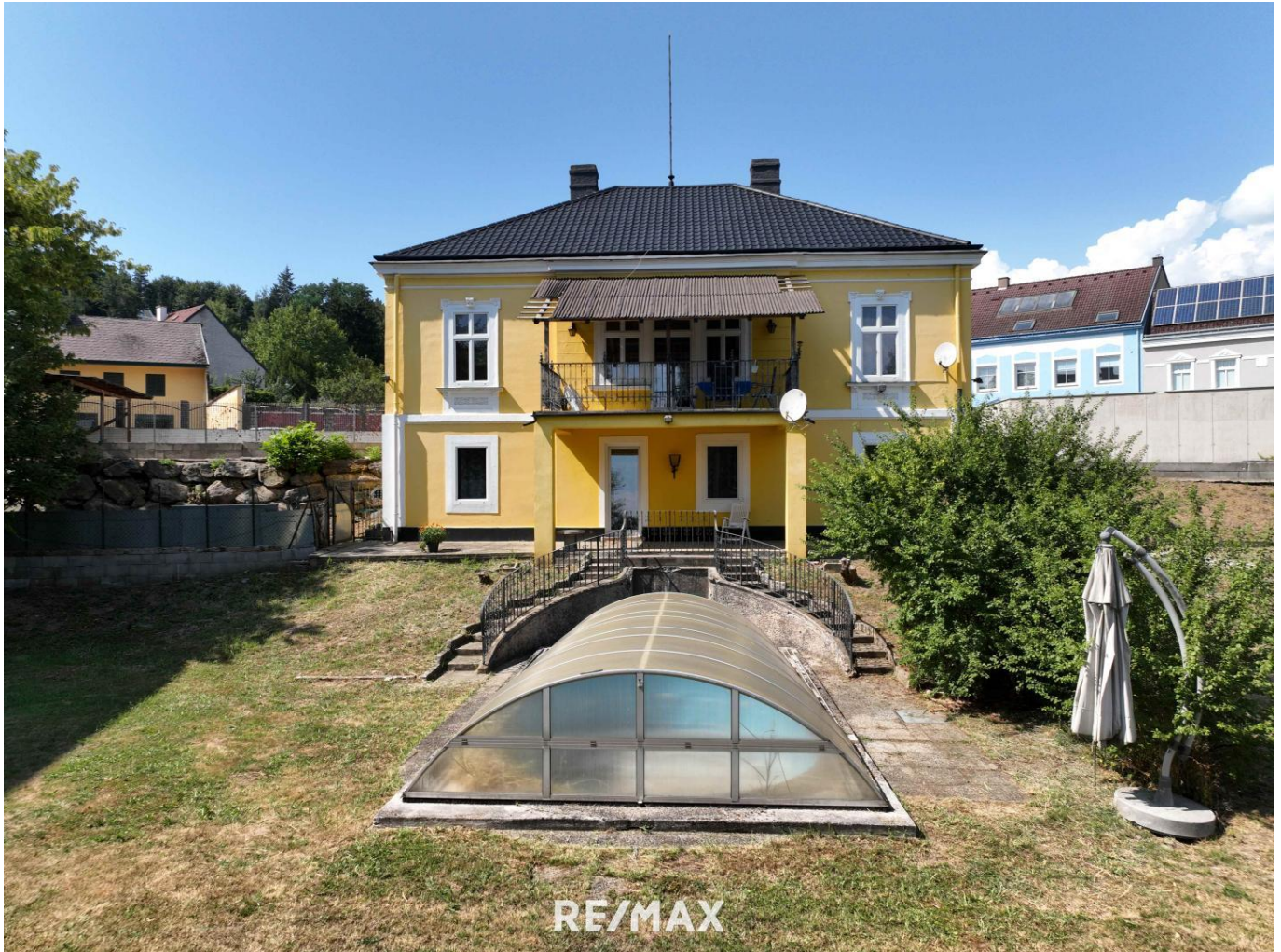
Ansicht vom Garten