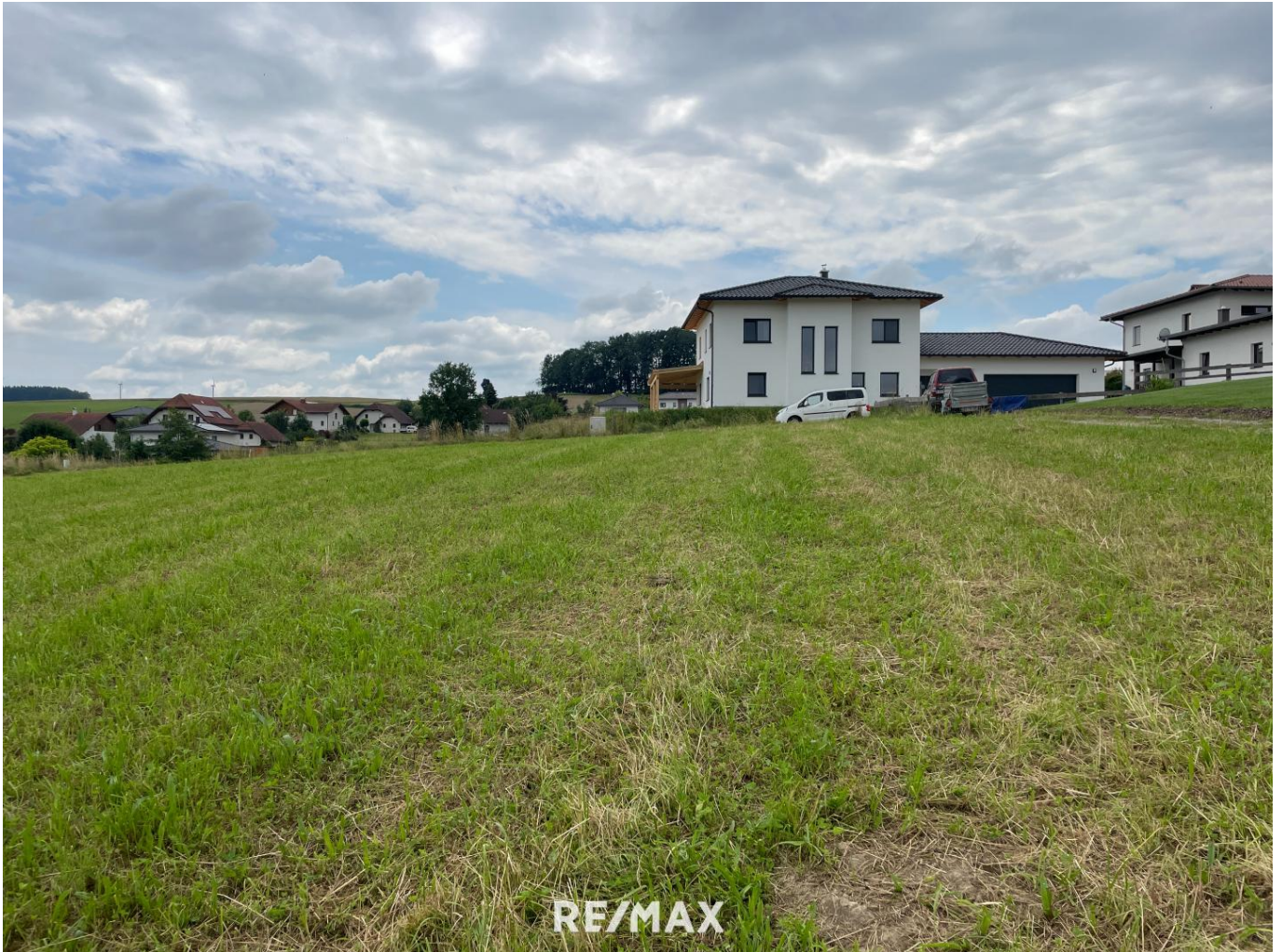
Grundstück Raab (1)