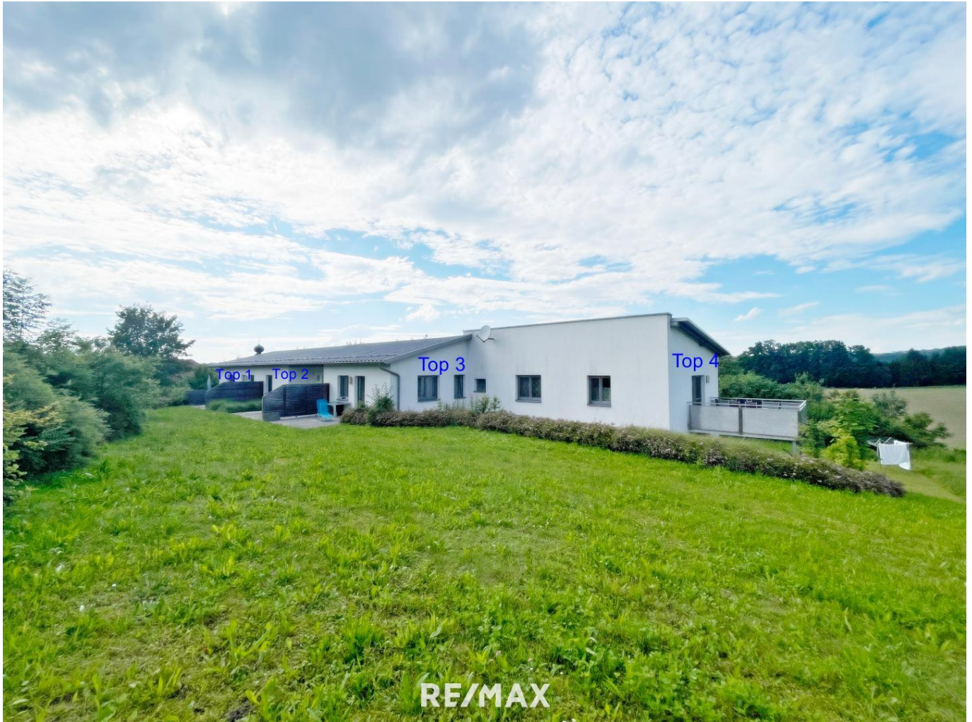
Wohnungen Diersbach (1)