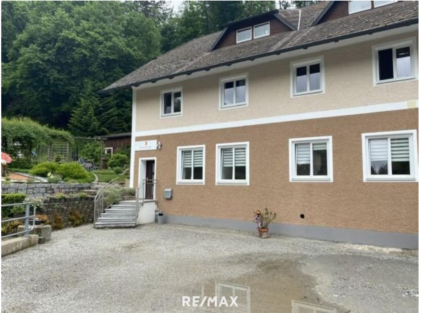
Büro Haibach (1)