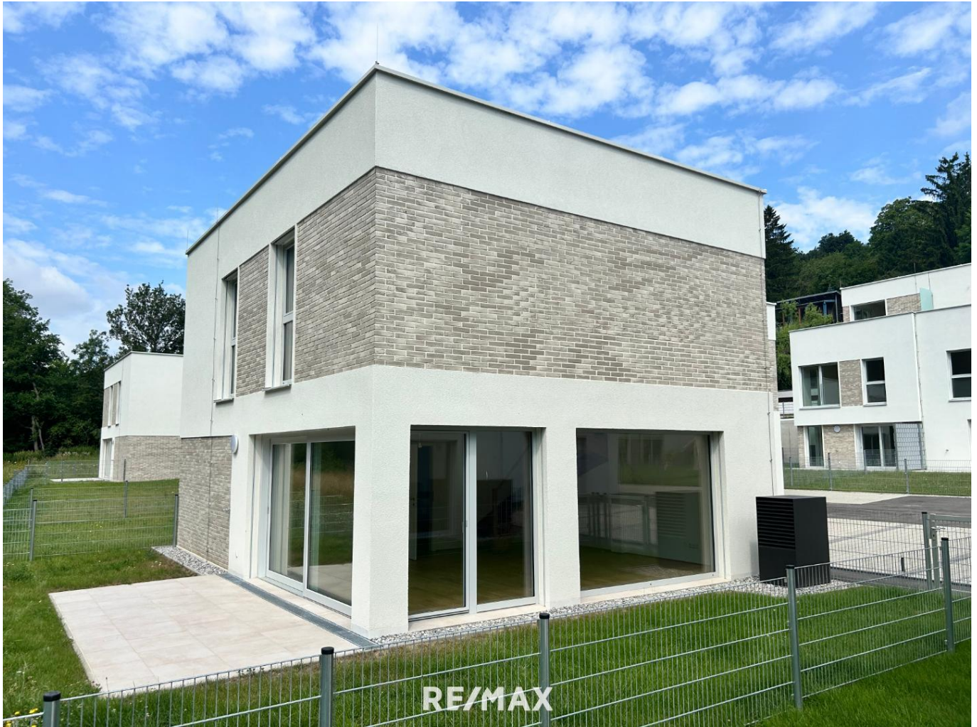
Haustyp IV - Haus 16