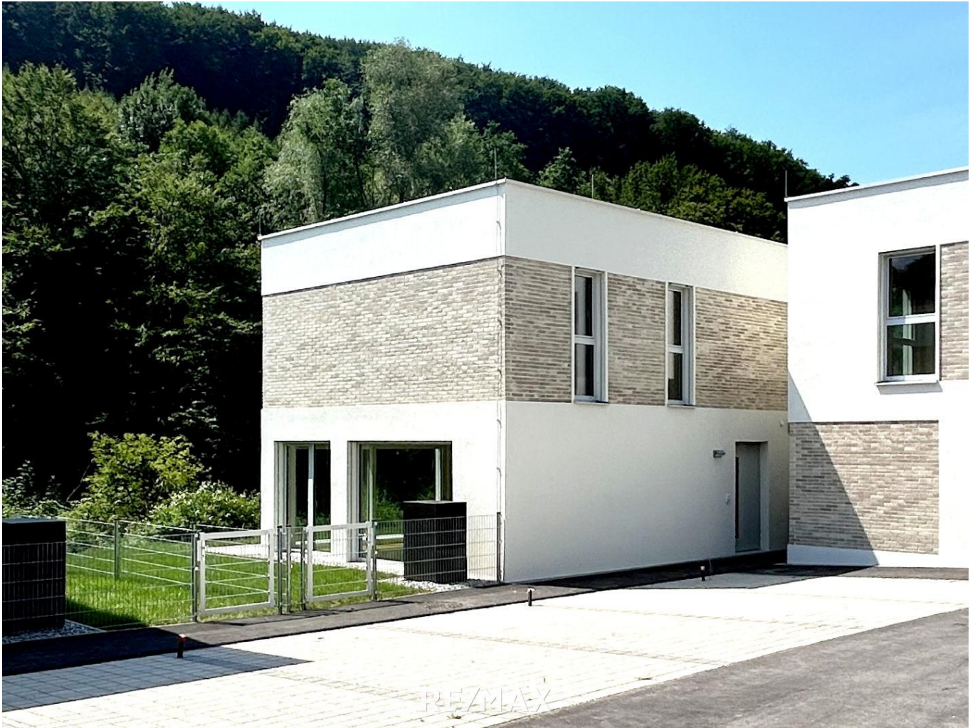
Haustyp IV - Haus 14