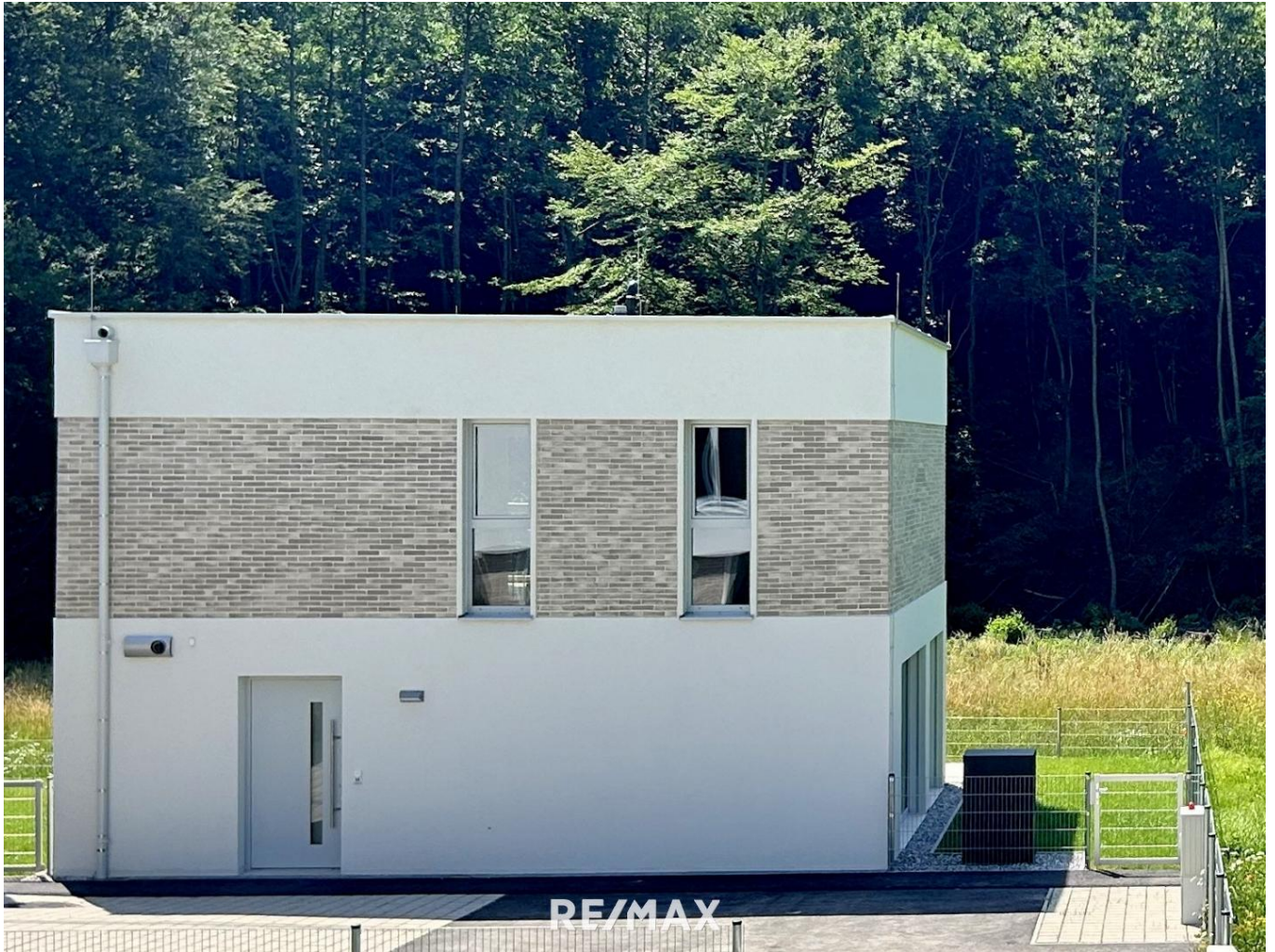
Haustyp III - Haus 11