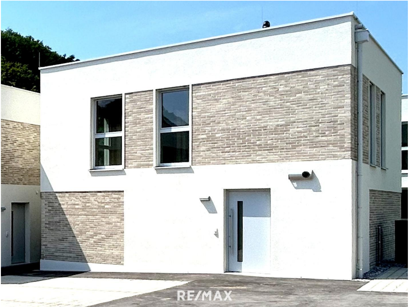
Haustyp II - Haus 17