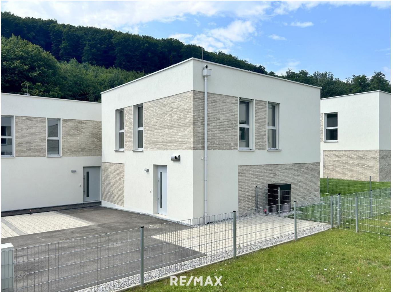
Haustyp II - Haus 15