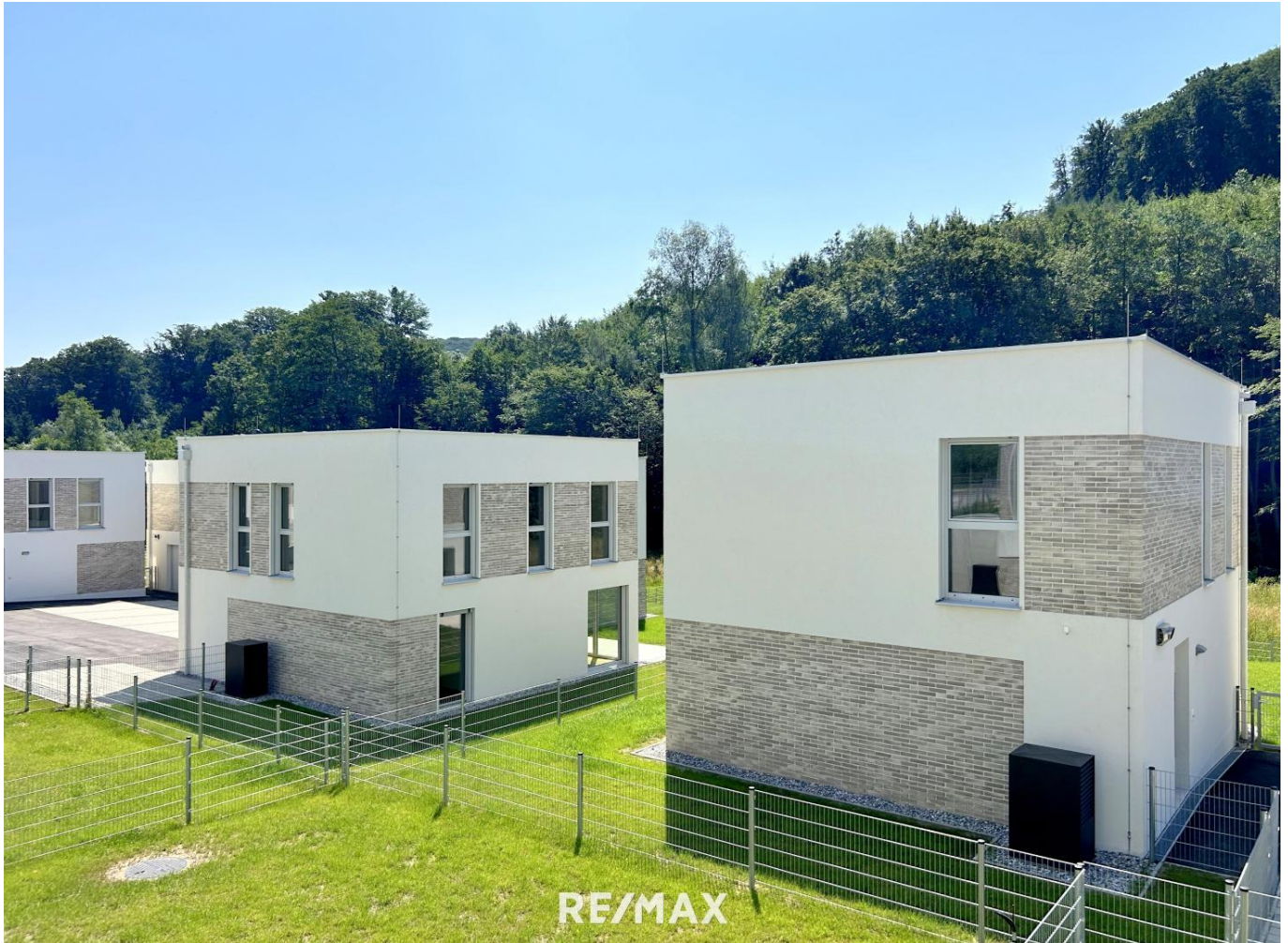
Haustyp II - Haus 13