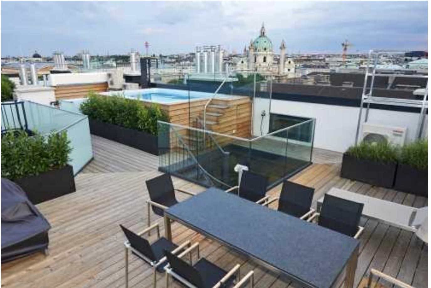
Terrasse mit Wienblick