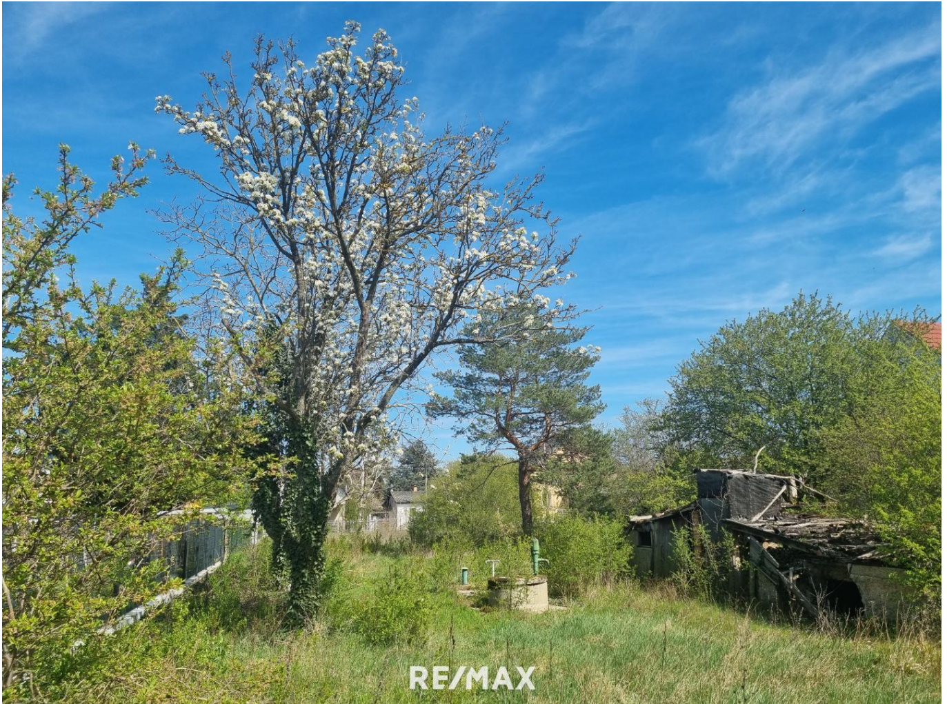
Grundstück mit Brunnen