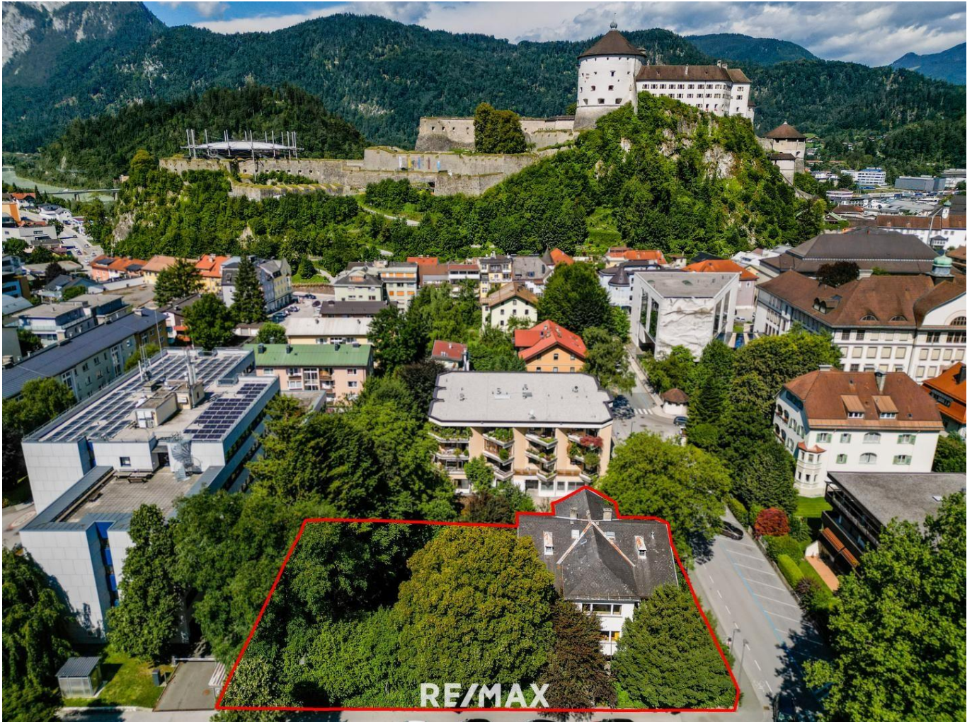
Ansicht_Richtung Westen Festungsblick