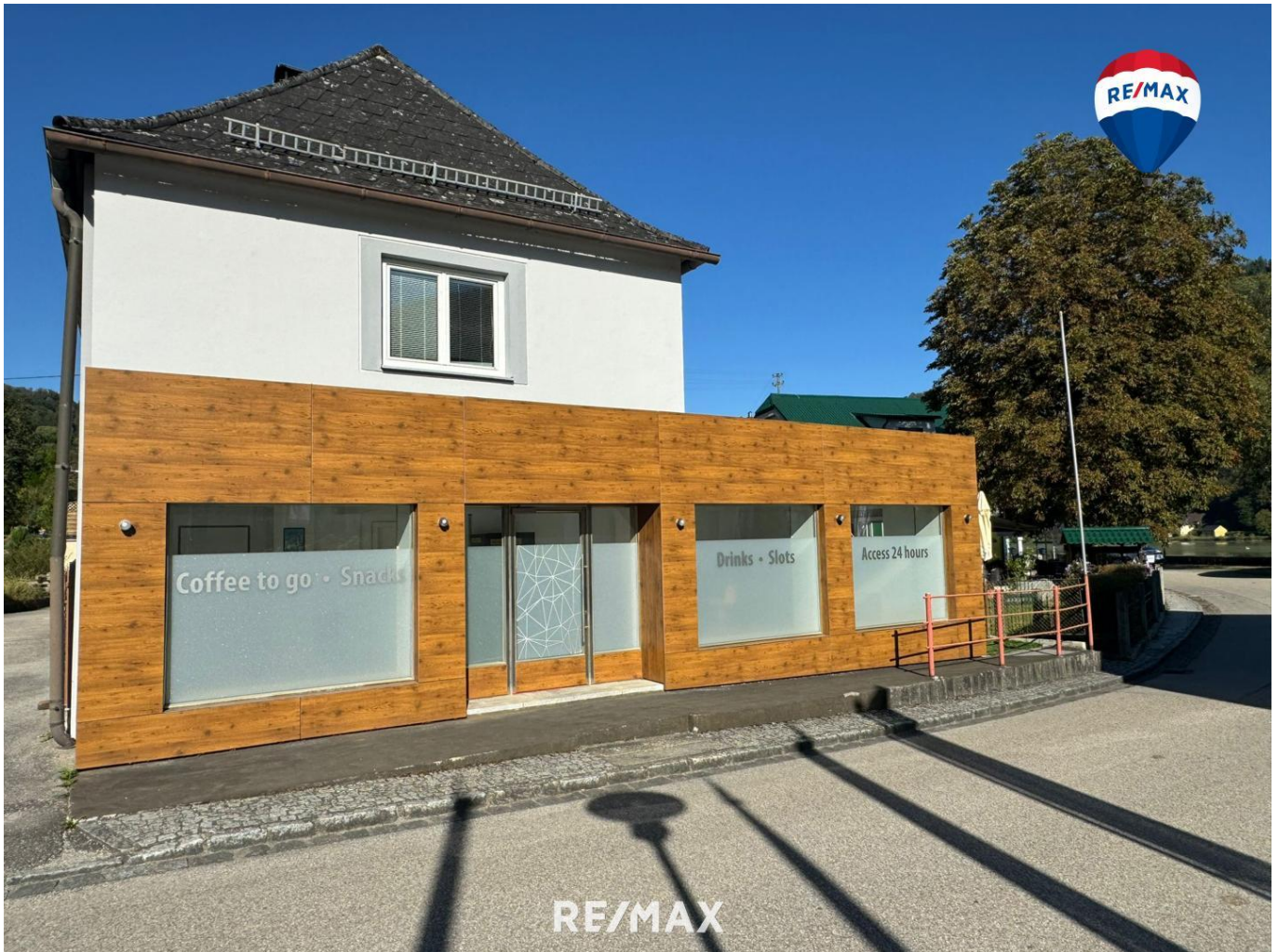
RE/MAX Ansicht Ost