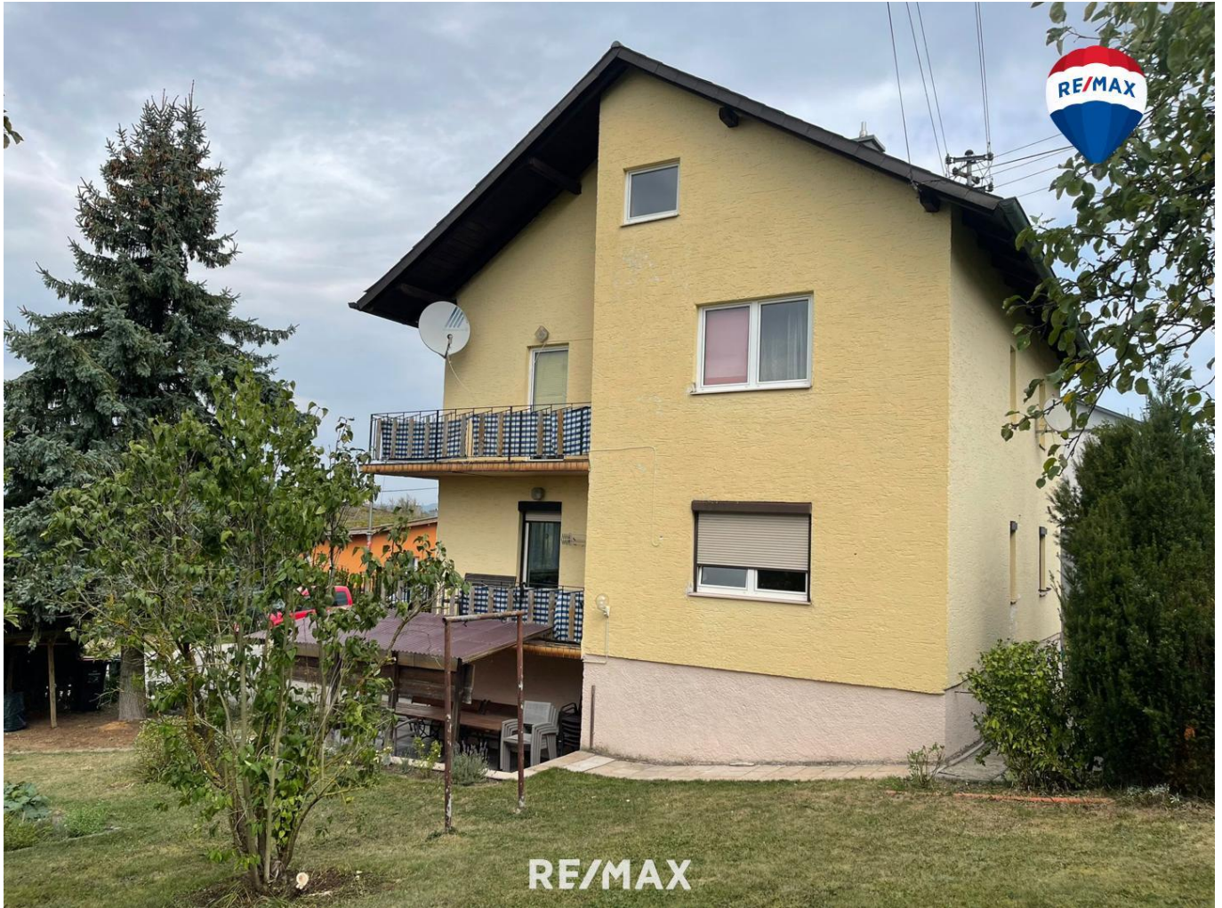
Titelbild - Ansicht Süd