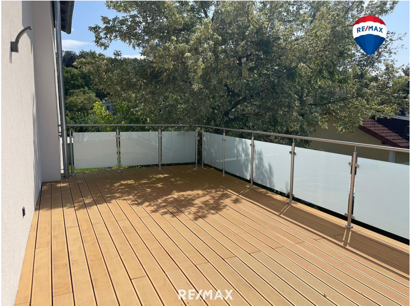
Titelbild - Ausblick Terrasse - West