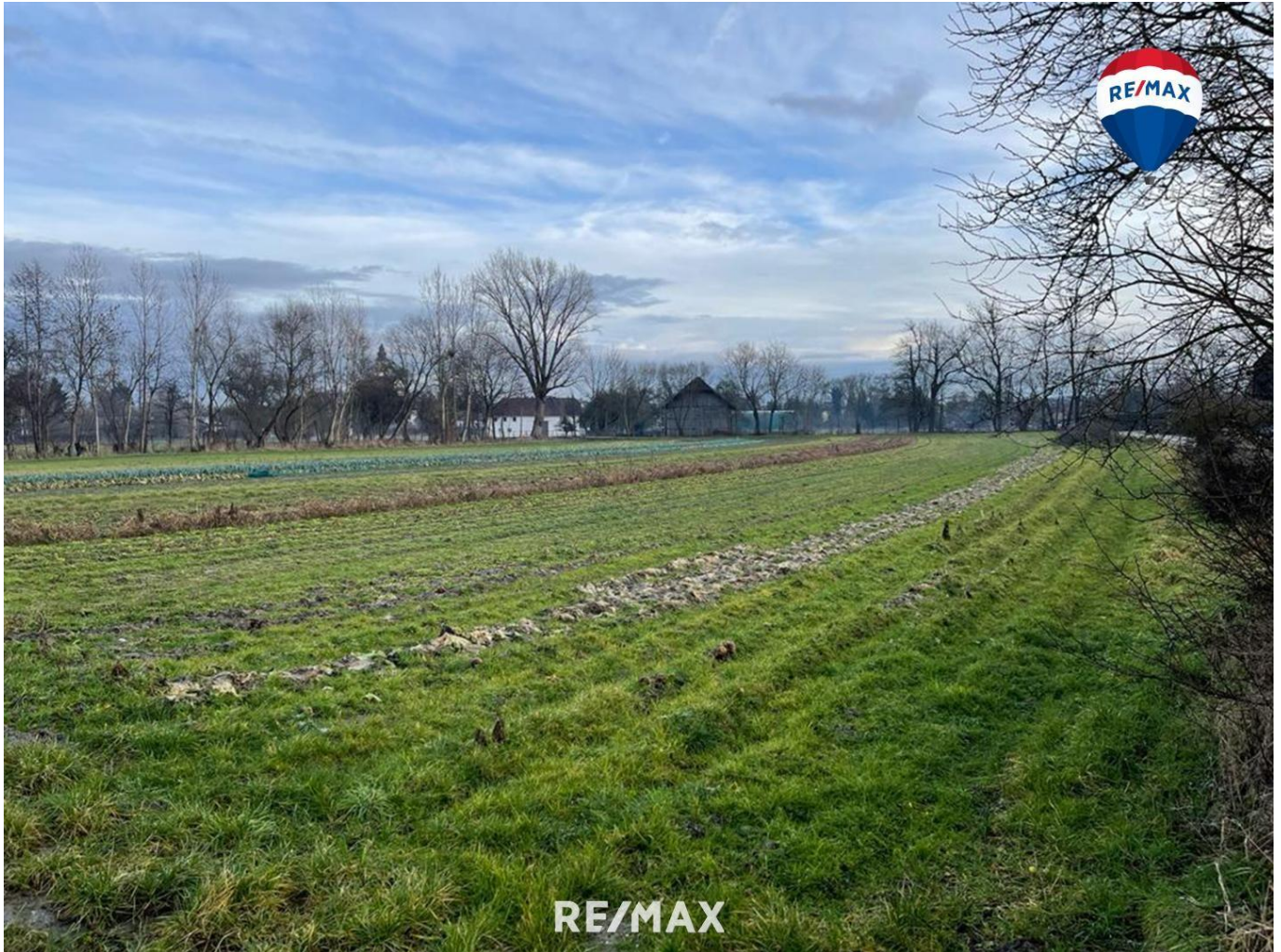
Titelbild - Grundstück am Gassfeld