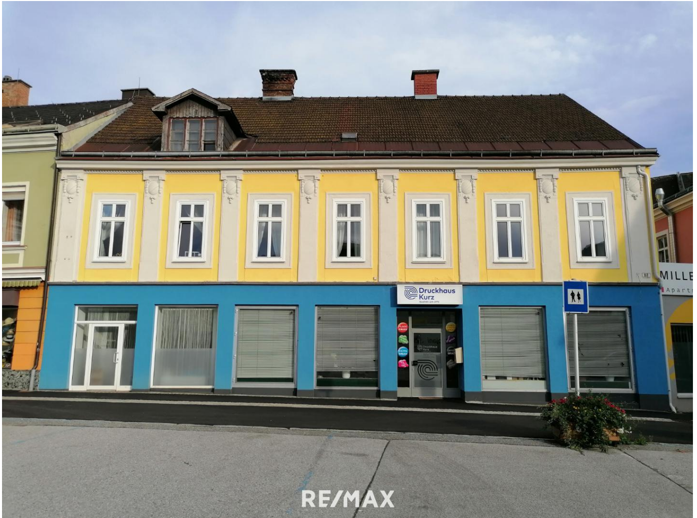
01 Außenansicht Jaklinplatz