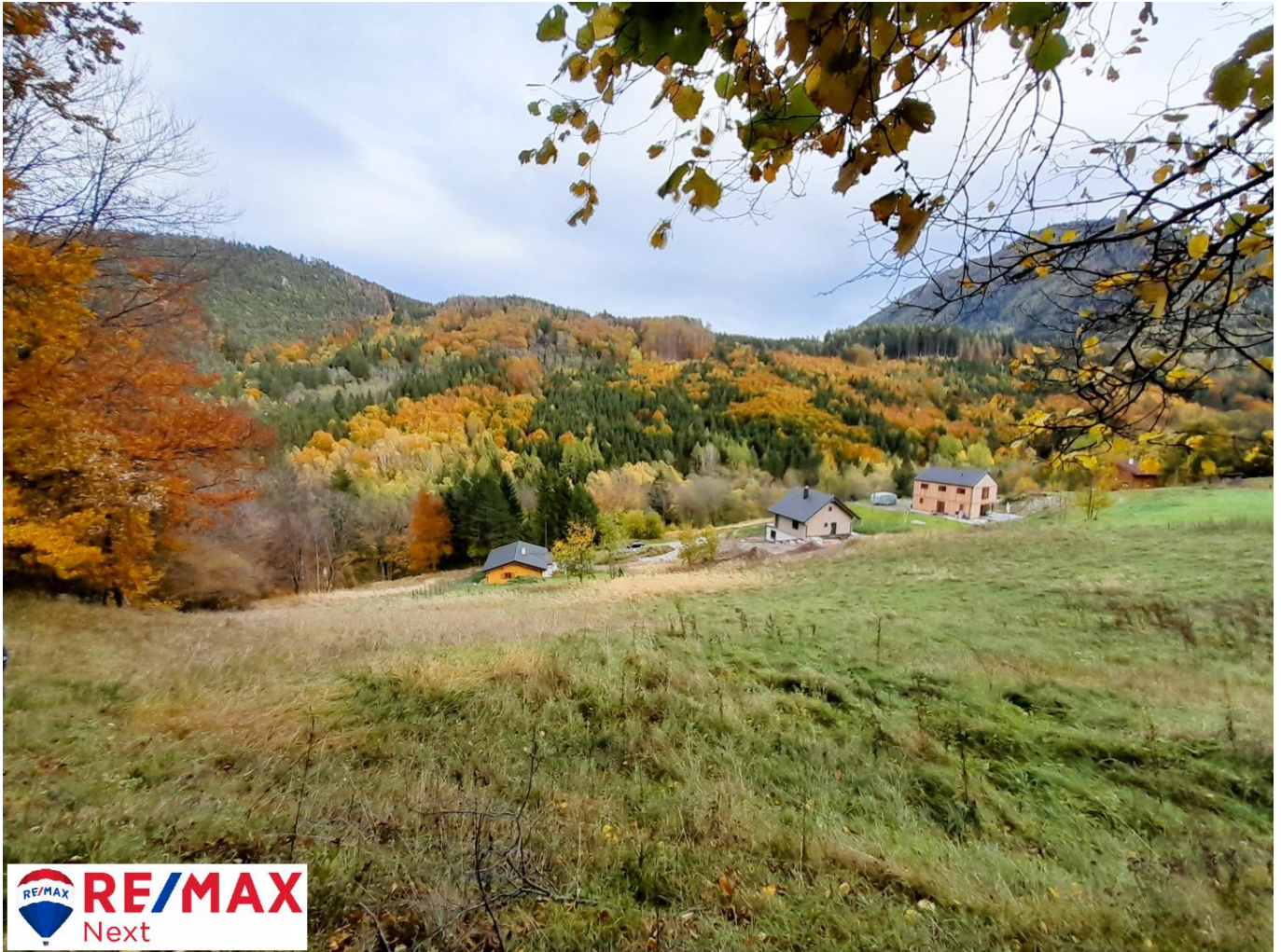
Sicht von der Grünlandparzelle