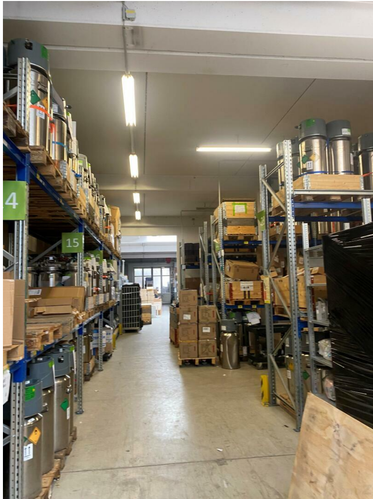
Halle mit Hochregalen

Lagerflächen- Nähe Süd Ost Tangente, teilbar, Parkplätze vorhanden.