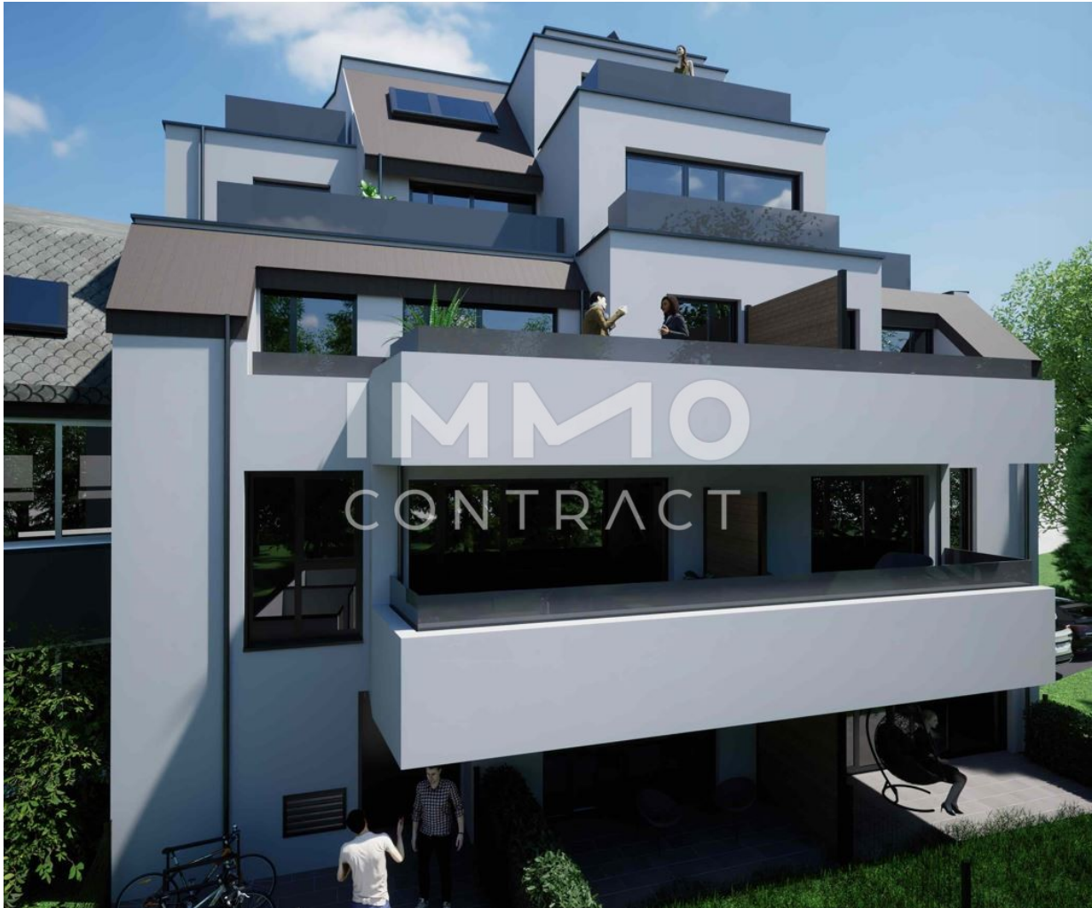
Tag Visu Rückseite