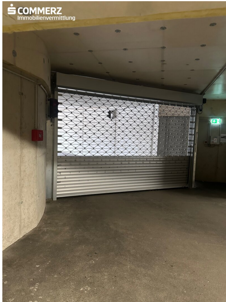
Ein- und Ausfahrt