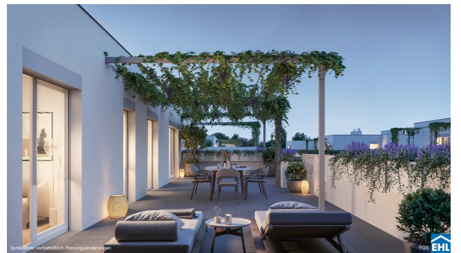
Symbofoto: vorbehaltlich Planungsänderungen