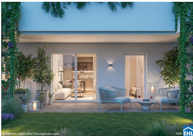
Symbolefoto: vorbehaltlich Planungsänderungen