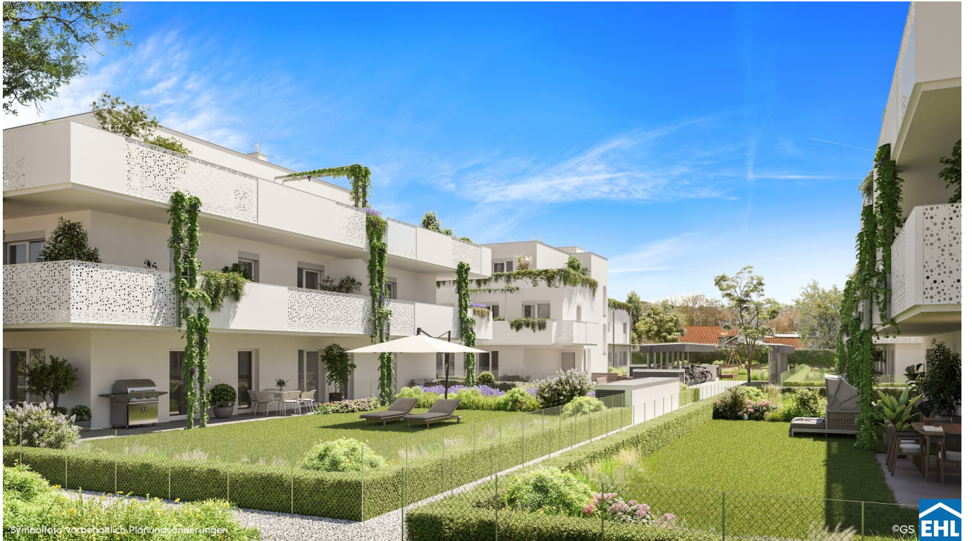
Symbolefoto: vorbehaltlich Planungsänderungen