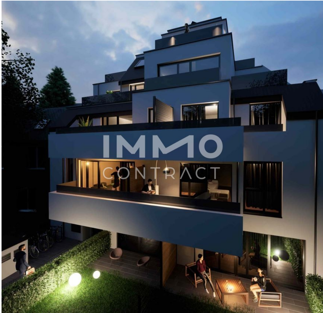
Nacht Visu Rückseite

*Provisionsfrei* Neubauwohnungen beim Freizeitparadies "alte Donau" 2-3 Zimmer; Freiflächen; Garagenstellplätze