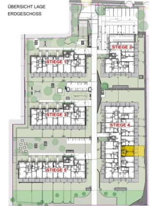
ÜBERSICHT LAGE ERDGESCHOSS

DIE ANGEgebenEN QUADRATMETERWERTE SIND CIRCA MAßE. MAßTOLERANZEN BIS ZU 3% DER GESAMTFLÄCHE SIND MÖGLICH.