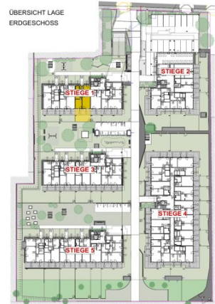
ÜBERSICHT LAGE ERDGESCHOSS

DIE ANGEgebenEN QUADRATMETERWERTE SIND CIRCA MAßE. MAßTOLERANZEN BIS ZU 3% DER GESAMTFLÄCHE SIND MÖGLICH.