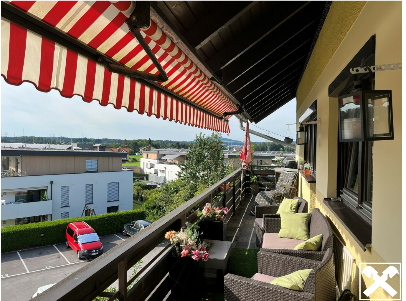
Balkon mit Aussicht