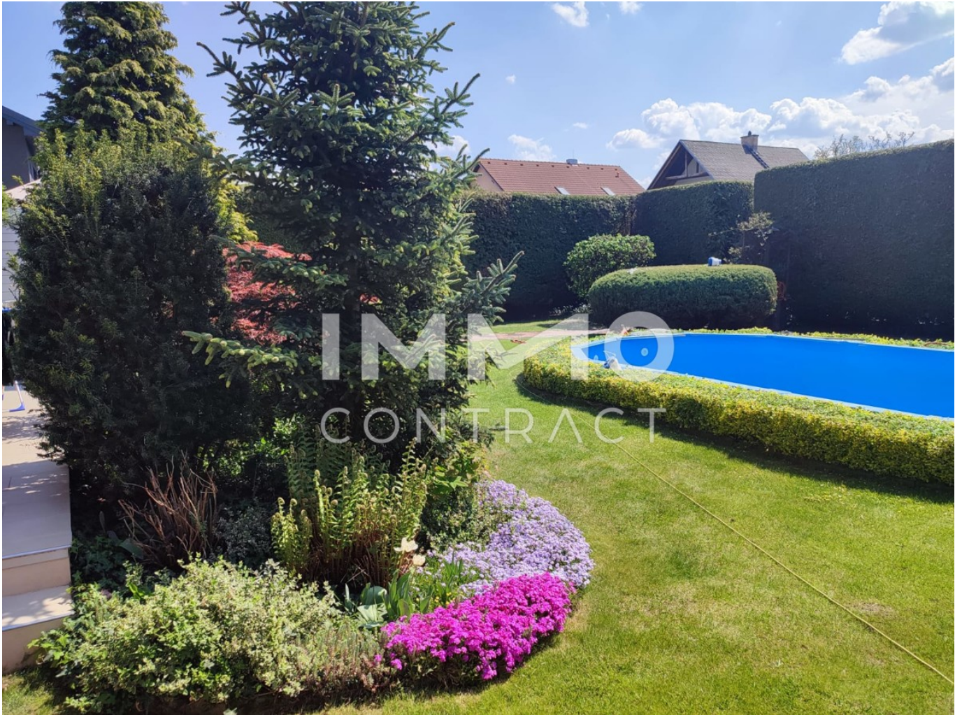
top gepflegter Garten