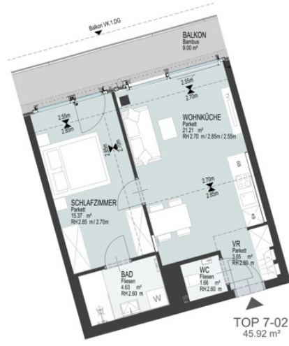
TOP 7-02 45,92 m 2