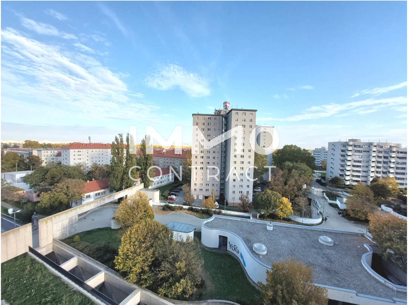
View Ausblick Morgensonne