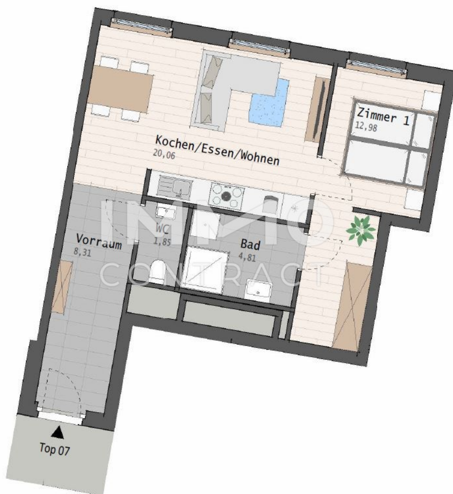
Top 7 Grundriss