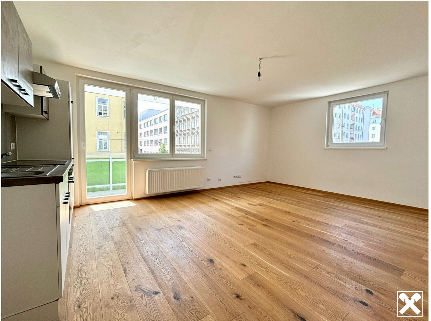
Wohnküche mit Blick auf Loggia