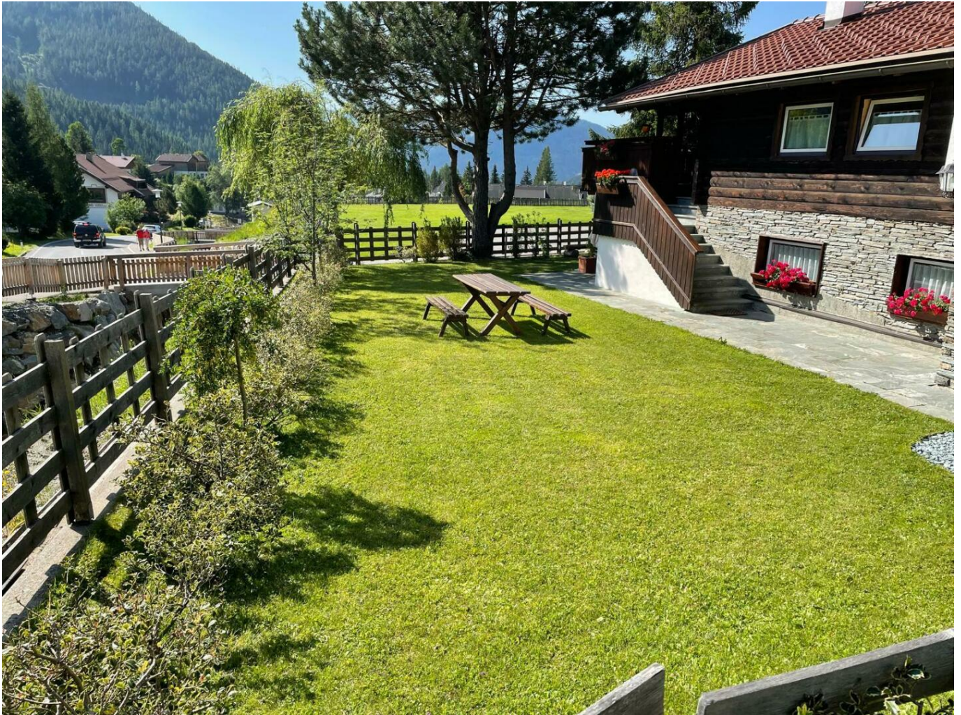
Haus St. Oswald kaufen (141)