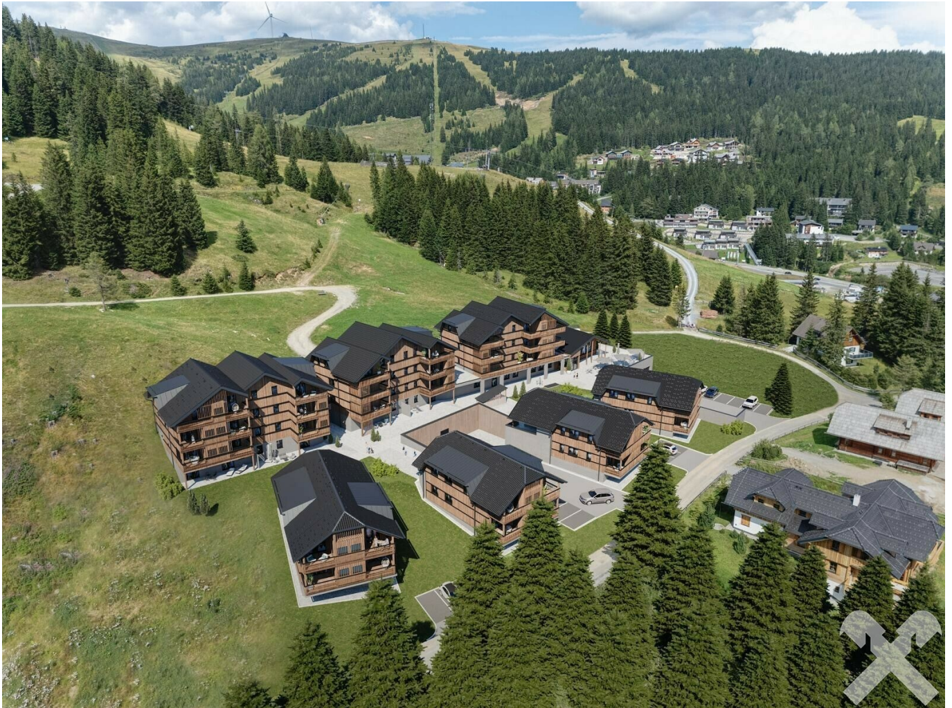
Rendering Projekt Lachtal