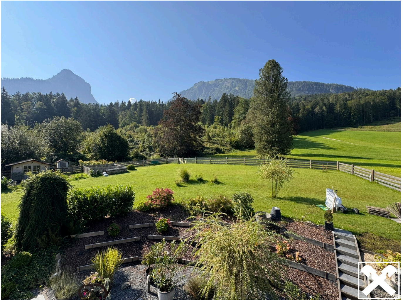
Blick vom Landhaus