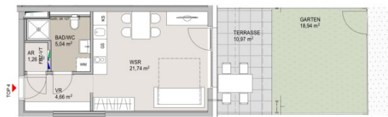
ÜBERSICHT LAGE ERDGESCHOSS