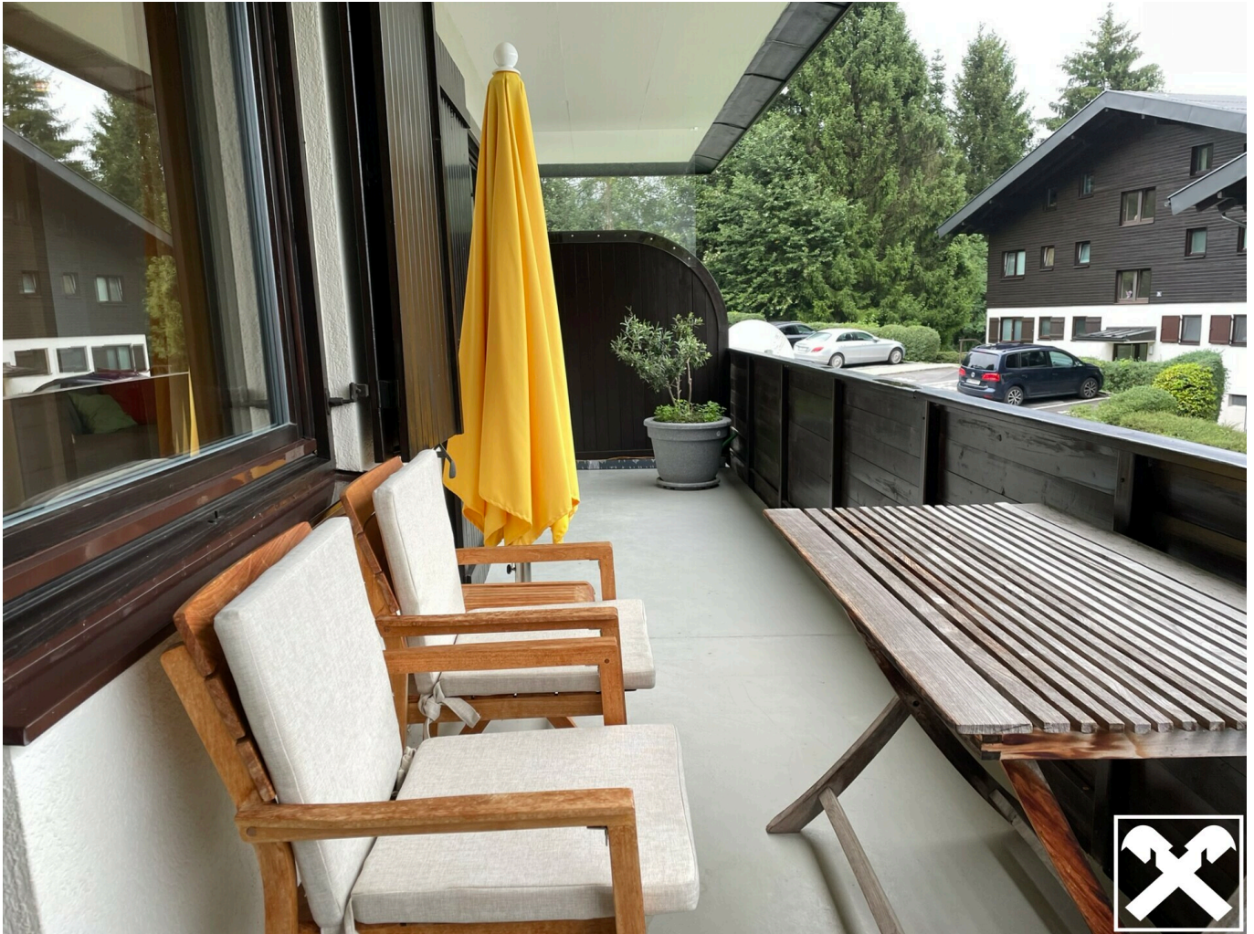
Großer überdachter Balkon