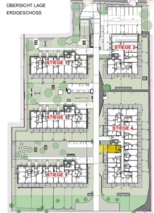
ÜBERSICHT LAGE ERDGESCHOSS

DIE ANGEgebenEN QUADRATMETERWERTE SIND CIRCA MAßE. MAßTOLERANZEN BIS ZU 3% DER GESAMTFLÄCHE SIND MÖGLICH.