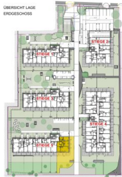
ÜBERSICHT LAGE ERDGESCHOSS

DIE ANGEGEBENEN QUADRATMETERWERTE SIND CIRCA MAß. MAßTOLERANZEN BIS ZU 3% DER GESAMTFLÄCHE SIND MÖGLICH.